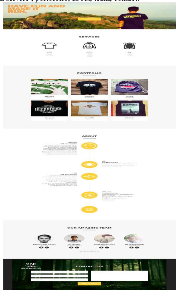
Gambar 4 Gambar Halaman Utama Homepage

Halaman pengguna adalah halaman yang paling pertama dan utama dari aplikasi berbasis website. Hal ini dirancang sebagai titik fokus pusat dari kegiatan yang berlangsung pada sebuah website. Melalui halaman pengguna pengunjung dapat melihat link-link dan konten yang telah disediakan sebagai fasilitas atau fitur dalam website. Menu-menu yang terdapat dalam company profile berbasis web CV. Oak Merch antara lain service, portofolio, about, team, contact.