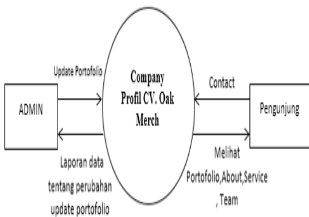
Gambar 2 Diagram konteks

Diagram konteks adalah DFD pertama dalam proses, menunjukkan proses dalam suatu proses tunggal (proses 0) dan semua entitas yang menerima atau memberikan informasi pada sistem.